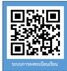
ระบบการลงทะเบียนเรียน

ผ่านระบบบริการการศึกษา (ESS) https://ess-register.rmuti.ac.th/AppKR/ ซึ่งจะมีรายการค่าใช้จ่ายค่าประกันของเสียหายและค่าประกันอุบัติเหตุ นำไปชำระเงินผ่านธนาคารกรุงไทย จำกัด (มหาชน)/ ธนาคารกรุงศรีอยุธยา จำกัด (มหาชน) ได้ทุกสาขาทั่วประเทศ วันที่ 8 – 9 มิถุนายน 2569