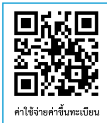
ค่าใช้จ่ายค่าขึ้นทะเบียน

1.1 กรอกข้อมูลประวัตินักศึกษา และพิมพ์ใบแจ้งชำระเงินขึ้นทะเบียนนักศึกษา/ใบเสร็จรับเงิน ผ่านระบบบริการการศึกษา (ESS) https://rmuti.me/nTSR9oelv เพื่อนำไปชำระเงินผ่านธนาคารกรุงไทย จำกัด (มหาชน) / ธนาคารกรุงศรีอยุธยา จำกัด (มหาชน) ได้ทุกสาขาทั่วประเทศ