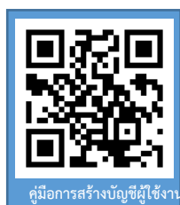
คู่มือการสร้างบัญชีผู้ใช้งาน