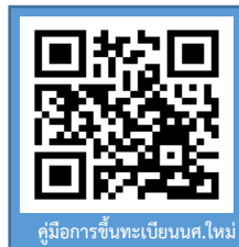
คู่มือการขึ้นทะเบียนนค.ใหม่