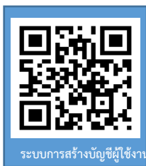
ระบบการสร้างบัญชีผู้ใช้งาน

หมายเหตุ : หากไม่พบรหัสประจำตัวนักศึกษา ให้นักศึกษาติดต่อมหาวิทยาลัย ภายใน 3 วันทำการ