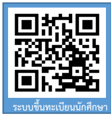
ระบบขึ้นทะเบียนนักศึกษา