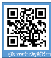
คู่มือการสร้างบัญชีผู้ใช้งาน